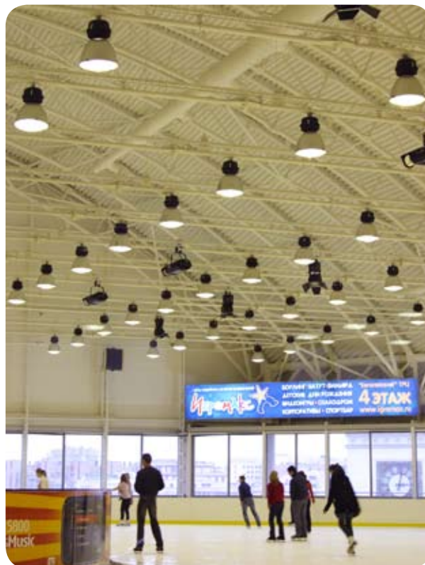
ТЦ «Европейский» (Москва)