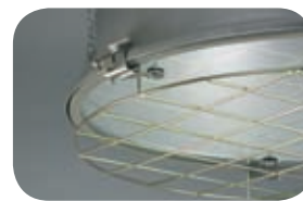
Светильник со стеклом и защитной решеткой. Код заказа решетки — 90102.